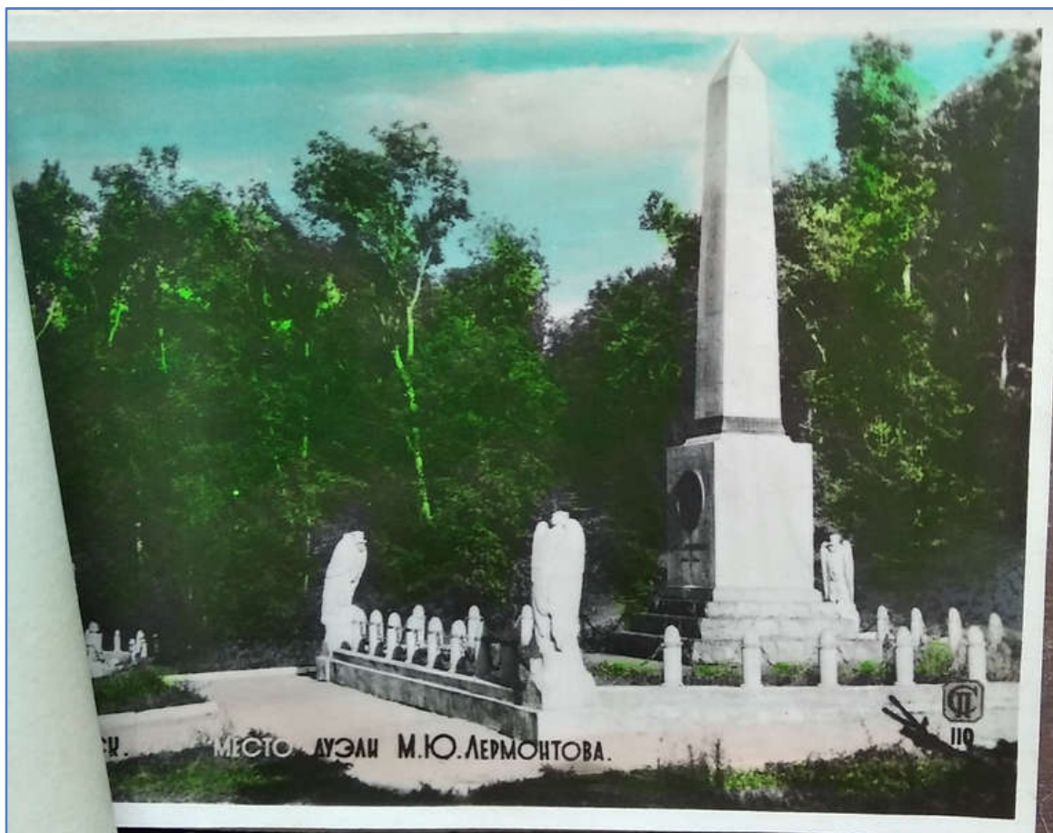
6. Место дуэли М.Ю. Лермонтова. Цв. "почтовая карточка" 1954 г. Маме тогда нравилось обшивать открытки. А мне эти грифы раньше напоминали химер Нотр-Дама. Известно, что скульптор обелиска был против их установки, как и ограды.